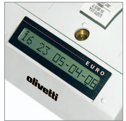
DISPLAY LCD RETROILLUMINATO